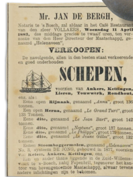
Advertentie van 10 april 1883 uit 'De Amsterdammer'.