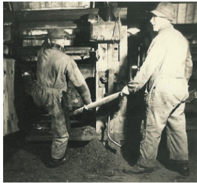
Gevaarlijk werk bij de balenpers in de Deurnese turfstrooiselfabriek bij Halte Helenaveen.

- In de nieuwe (geheel houten) turfstrooiselfabriek – waarschijnlijk is dit de eerste in zijn soort in Nederland – wordt dit jaar 562.000 ton grauwe turf verwerkt. Men exporteert het strooisel, geperst en verpakt in balen ook naar het buitenland. Vanuit 'Halte Helenaveen' – inmiddels uitgegroeid tot een van de grootste goederenstations van Nederland – wordt het turfstrooisel vervoerd naar o.a. Frankrijk, Engeland en via Rotterdam zelfs naar Amerika. Vooral paardentram-maatschappijen in binnen- en buitenland maken dankbaar gebruik van dit goedkope en hygiënische product. Het strooisel vervangt het stro in de stallen.