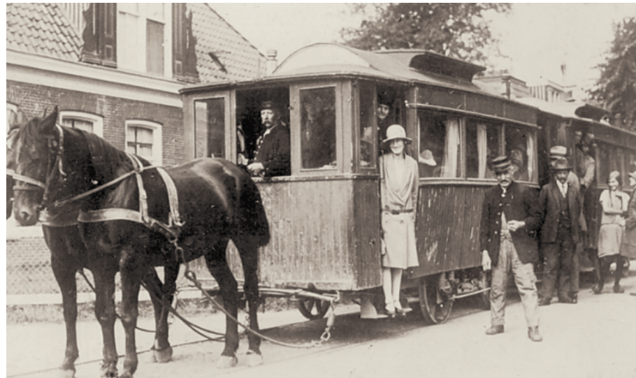
De laatste paardentram in Nederland rijdt op 16 juli 1930 tussen Harkezijl en Makkum in Friesland. 1

- In de nieuwe (geheel houten) turfstrooiselfabriek – waarschijnlijk is dit de eerste in zijn soort in Nederland – wordt dit jaar 562.000 ton grauwe turf verwerkt. Men exporteert het strooisel, geperst en verpakt in balen ook naar het buitenland. Vanuit 'Halte Helenaveen' – inmiddels uitgegroeid tot een van de grootste goederenstations van Nederland – wordt het turfstrooisel vervoerd naar o.a. Frankrijk, Engeland en via Rotterdam zelfs naar Amerika. Vooral paardentram-maatschappijen in binnen- en buitenland maken dankbaar gebruik van dit goedkope en hygiënische product. Het strooisel vervangt het stro in de stallen.