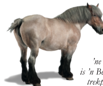
'ne Knol' is 'n Belgisch trekpaard.

- 1882 is een rampjaar: er heeft zich in de Peel een roodvonk-epidemie voorgedaan. Er zijn alleen al in dit jaar zeker 24 Helenaveners overleden.